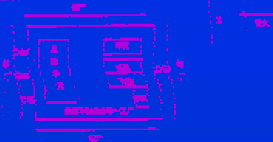
图二 甲醛释放量检测结果示意图